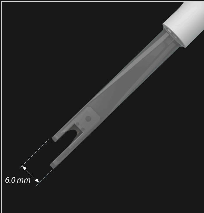
Fig.: Cuchilla de corte aislada, efecto atraumático del Carpolux.

Es un sistema de iluminación integrado que proporciona una mejor visualización de la región tratada, permitiendo una técnica segura y eficaz, además de reducir el tiempo quirúrgico y la morbilidad en los tejidos blandos.